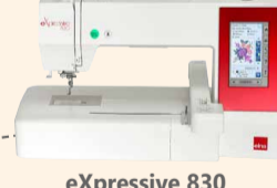
eXpressive 830 UVP 1.999 € Aktionspreis 1.699 €