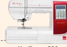
eXcellence 580+ Fashion & Decor UVP 1.299 € Eintauschpreis 1.149 € inkl. Bonus-Zubehör