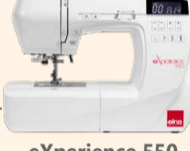
eXperience 550 UVP 819 € Eintauschpreis 699 €