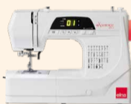
eXperience 450 UVP 449 € Eintauschpreis 389 €