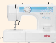
eXplore 150 UVP 299 € Eintauschpreis 269 €