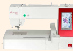
eXpressive 830 UVP 2.836 € Sparpaket 2.099 € inkl. Kreativ-Komplett-Set + Software eXuberance Junior