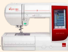
eXpressive 850 UVP 2.399 € Aktionspreis 2.099 €