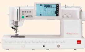
eXcellence 790PRO UVP 4.499 € Eintauschpreis 3.999 €