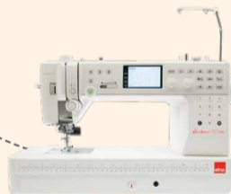
eXcellence 720PRO UVP 2.249 € Eintauschpreis 1.999 €