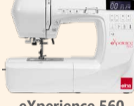
eXperience 560 UVP 929 € Eintauschpreis 799 €