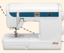
3210 Jeans UVP 669 € Eintauschpreis 599 €