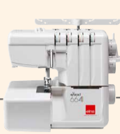
664 Vers. 2 UVP 679 € Upgrade-Aktion 599 €