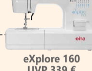
eXplore 160 UVP 339 € Eintauschpreis 299 €