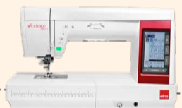
eXcellence 780+ UVP 3.349 € Eintauschpreis 2.999 €