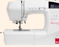
eXperience 570alpha UVP 1.039 € Eintauschpreis 899 €