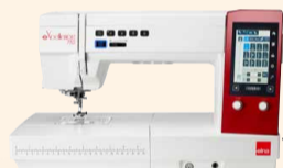
eXcellence 782 UVP 4.499 € Einführungspreis 3.999 €