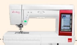
eXcellence 770 UVP 2.799 € Eintauschpreis 2.499 € inkl. Perfect-Fashion-Kit