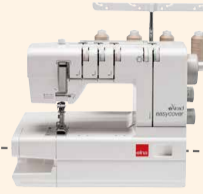
easycover Vers. 2 UVP 849 € Upgrade-Aktion 699 €