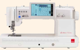
eXcellence 792PRO UVP 5.499 € Eintauschpreis 4.999 €