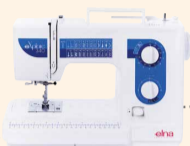
eXplore 340 UVP 619 € Eintauschpreis 549 €