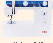
eXplore 240 UVP 449 € Eintauschpreis 399 €