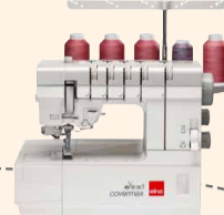
covermax UVP 1.199 € Upgrade-Aktion 999 €