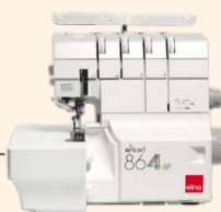
864air UVP 1.299 € Upgrade-Aktion 1.099 €