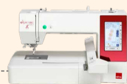
eXpressive 830L UVP 3.136 € Sparpaket 2.299 € inkl. Kreativ-Komplett-Set + Software eXuberance Junior