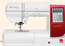
eXcellence 680+ Fashion & Decor UVP 1.499 € Eintauschpreis 1.299 € inkl. Bonus-Zubehör