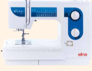
eXplore 320 UVP 559 € Eintauschpreis 499 €