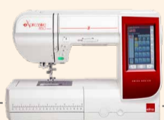
eXpressive 850 UVP 3.236 € Sparpaket 2.499 € inkl. Kreativ-Komplett-Set + Software eXuberance Junior