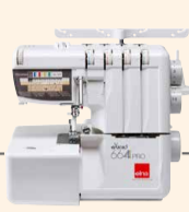
664PRO Vers. 2 UVP 849 € Upgrade-Aktion 749 €