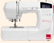
eXperience 530 UVP 699 € Eintauschpreis 599 €