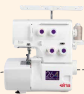
Overlock 264 UVP 529 € Upgrade-Aktion 469 €